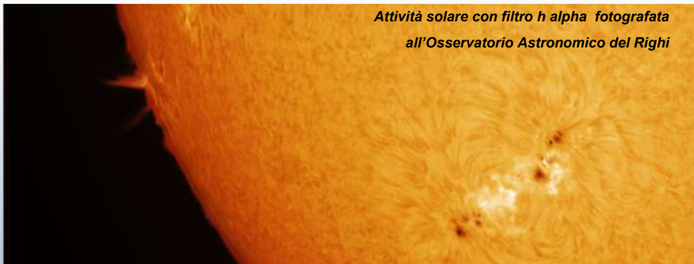
Attività solare con filtro h alpha fotografata all'Osservatorio Astronomico del Righi