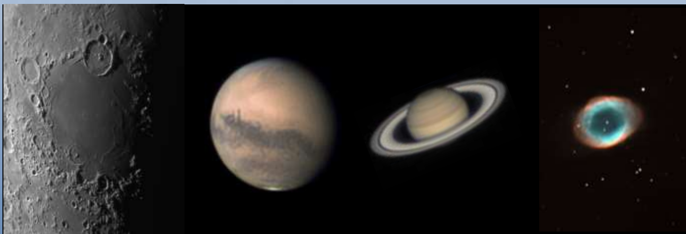
La Luna, Marte, Saturno e la Nebulosa Anulare della Lira, ripresi dall'Osservatorio del Righi

le osservazioni al telescopio si possono svolgere solo in caso di condizioni meteo favorevoli, nel caso in cui il meteo non consentisse l'osservazione diretta è possibile rinviare l'incontro o sostituire l'osservazione con uno dei laboratori didattici proposti o con l'animazione all'interno del Planetario Digitale